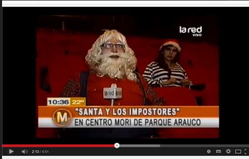
Nota de prensa REDTV Programa "Mañaneros"