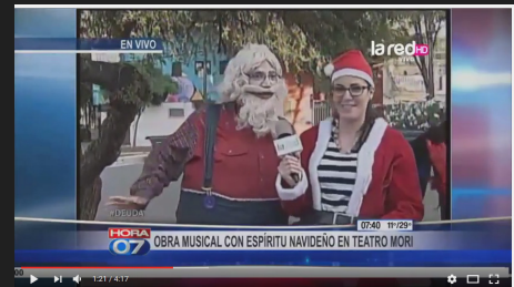
Nota de prensa REDTV Programa "HORA 07"